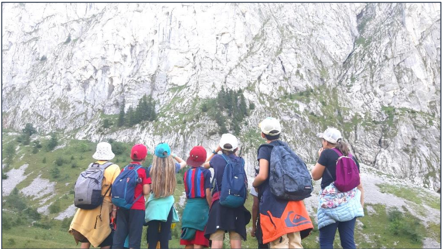
Admirez le Chauffé