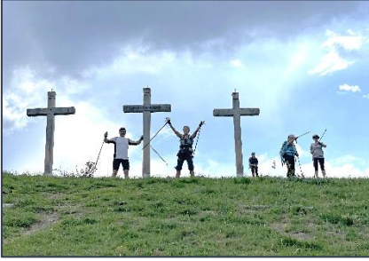
02 et 03/06—Marche Nordique à Ubine