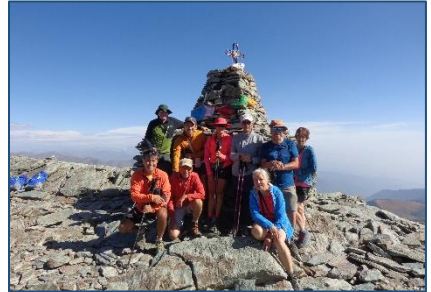
Du 22 au 31/08 – Le Queyras