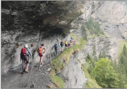
17/08/23 – Belle Etoile (RM)