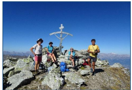
Du 25/09 au 04/10 – Le Valais