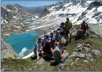
Du 22/06 au 02/07 – Les Grisons