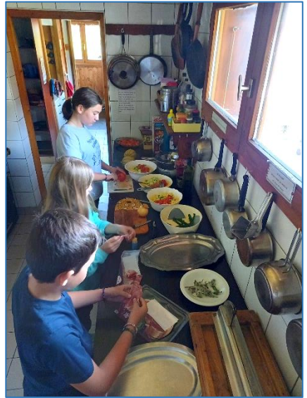
Préparation du repas