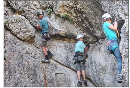
14/07/23 – Via ferrata Bellevaux