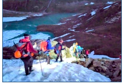
24 et 25/06 – Dôme de Polset