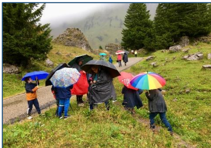
Du 28 au 30/08 –Séjour enfants à Ubine