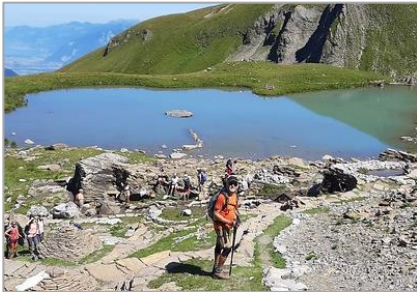
09/08/20 – Lac de Soi