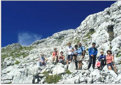
6 au 12/07/20 – Au cœur de la Suisse