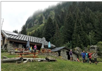
06/09/20 – Alpage de Lens (RP)