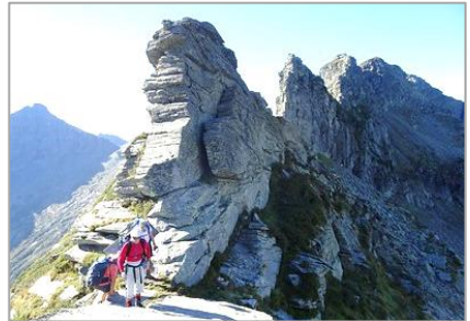
07 au 12/09/20 – Via Alta Tessin