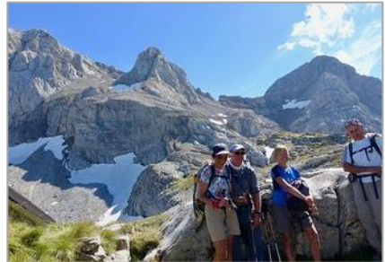
03/09/20 – Dents Blanches