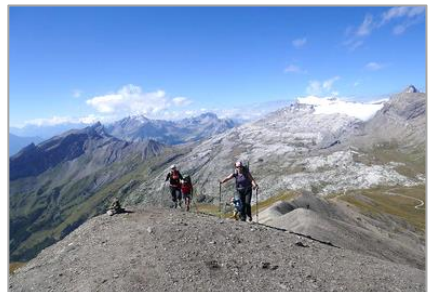
05 et 06/09/20 Arpelistoch/Gettenhorn