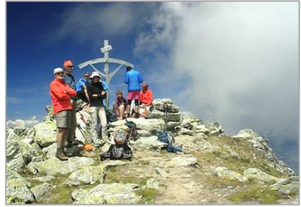
19/07/20 – Pic d'Artsinol