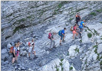
30/07/20 – Cabane Rambert