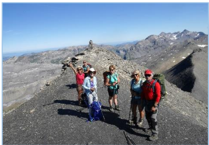
25/08/19 – Le Buet