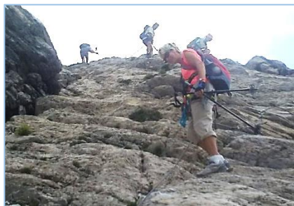
08/08/19 – Via ferrata du Charvin