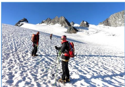
29 et 30/06/19 – Péclet-Polset