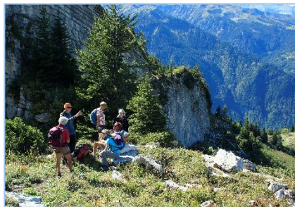
29/09/19 – Pointe de Ressassat