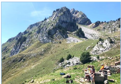
04/08/19 – Pointe de Chambairy