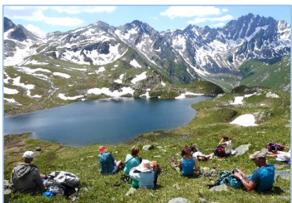
14/07/19 – Lacs du Grand St Bernard