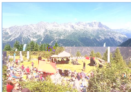
25/07/19 – CosmoJazz