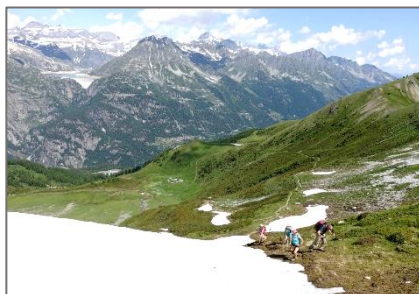
04/07/19 – Col de Balme